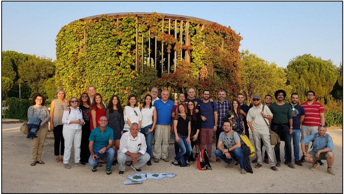
Foto de grupo, con hojas de diferentes tipos de parra recolectadas, en el Encín