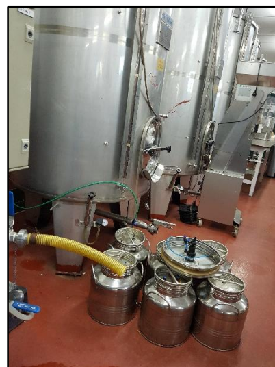
Visita a la bodega experimental y las “lecheras” de la Finca el Encín del IMIDRA