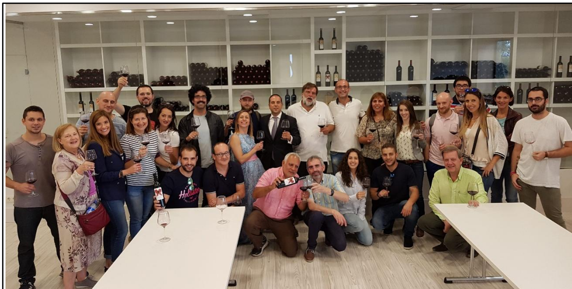
Foto de grupo en la sala de catas de El Regajal