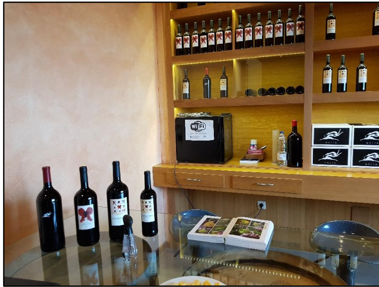
De izda a dcha. Galia, el Regajal Selección Especial y las Retamas del Regajal