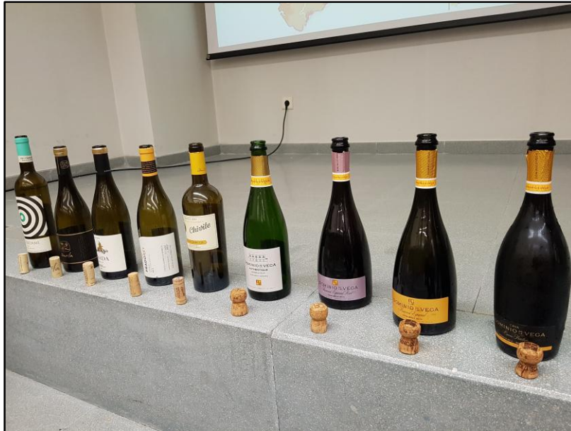
Cata de vinos blancos