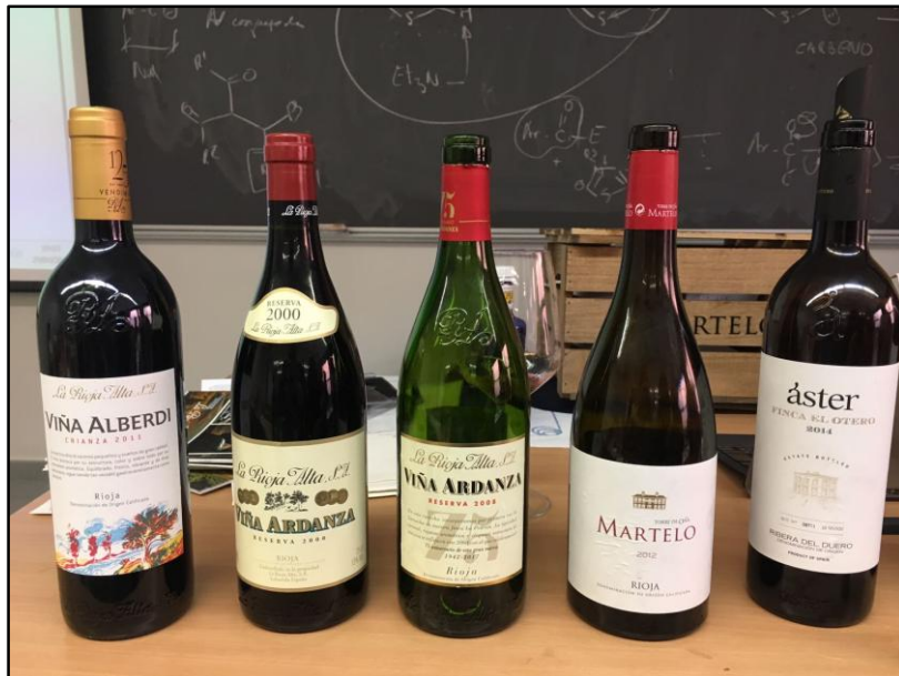
Cata de vinos tintos