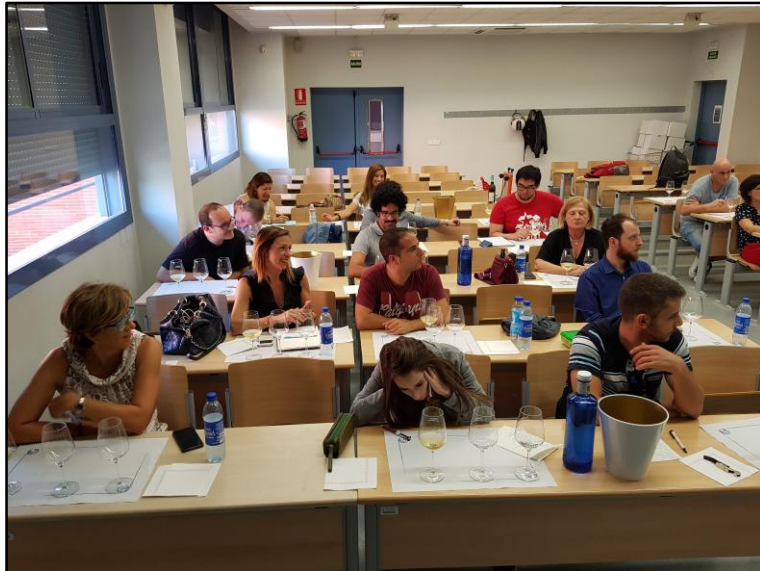
Aula de catas