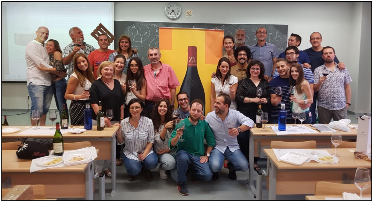
Foto final del curso